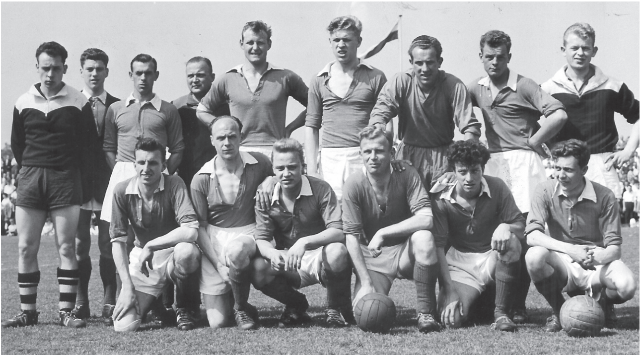
Kampioensteam v.v. Gouda seizoen 1958-1959