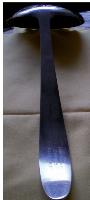
Bestek aangeboden na behaalde landstitel seizoen 1958-1959.

Dit waren prachtige wedstrijden met veel publiek (12.000) per wedstrijd. (verslagen zijn te vinden op deze site).