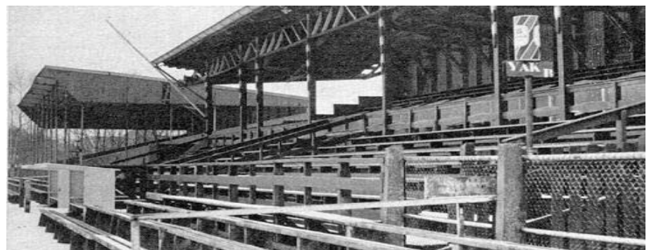
Oude tribune FC Heracles

De eens zo trotse club uit Almelo was inmiddels naar de Tweede Divisie B van de K.N.V.B. (Koninklijke Nederlandse Voetbal Bond = opvolger van de N.V.B.) afgedaald. Hoe lang kon men in Almelo nog lijdzaam toezien dat de zwart-witte formatie doelloos in de marge van het betaalde voetbal opereerde?