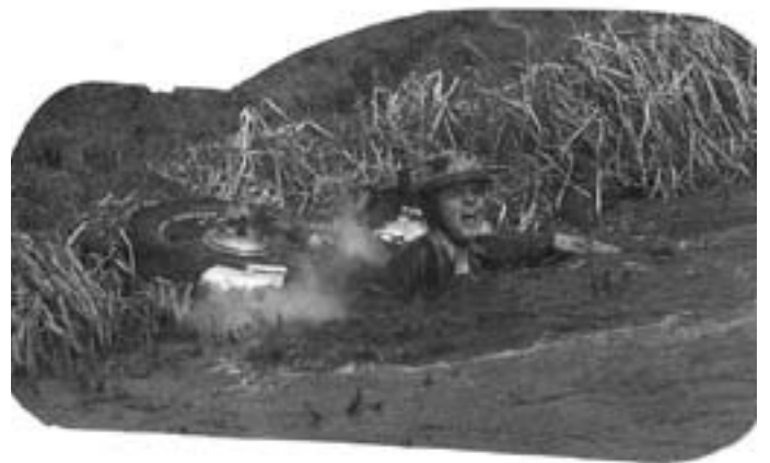
Langzaam werd ik de modder ingetrokken. Als ik de foto zie ruik ik nog die enorme modder-stank!!

Uiteindelijk, toen het blubberwater bijna aan mijn lippen stond zagen ze dat het toch wel ernst was. Enkele omstanders sprongen tot aan hun middel in de sloot en haalden mij eruit. Stinkend duwden we mijn motor naar het rennerskwartier, maakten hem weer klaar voor de tweede manche, ik heb droge kleren aangetrokken en ben weer van start gegaan.