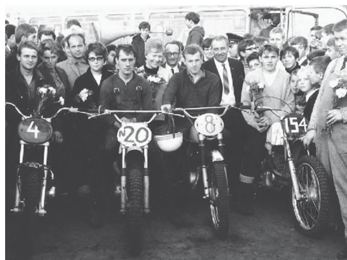
Gelijk ook maar even gewonnen!! Winnaars huldiging in Enschede. No. 4 ben ik.