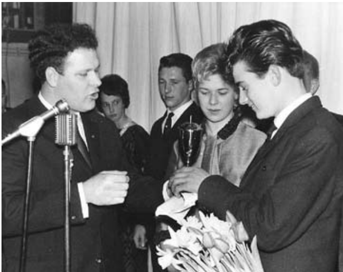
Foto: Joop overhandigt mij de kampioensbeker. Verder zien we mijn toenmalige vriendin Wil en Frits Vos met vrouw.

Ik weet dat hij dat met veel genoegen deed omdat mijn succes ook een beetje aan hem toebehoorde.