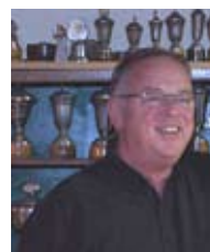
Verslaggeving: André den Edel

Misschien waren de geserveerde drankjes en de hapjes wel te hallucinerend.