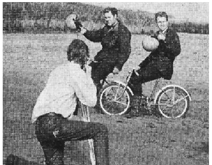
Op de drooggevalle Biesbosch bij eb. Op kinderfietsjes!!

Op een stuk drooggevalle rivierbodem moest gecroost worden. Dat lukte niet want de motoren waren te zwaar. Het werden dus kinderfietsjes waarop wij achter de dief aan moesten.