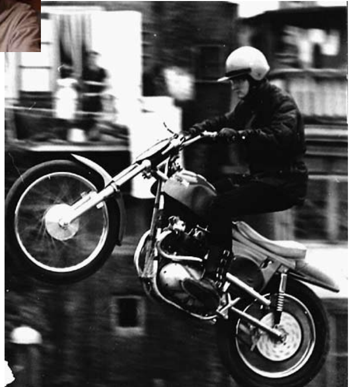
Springend ga ik door de binnenstad van Dordrecht.